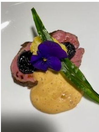
Pflümli-Sunntig Kalb, Cognac-Dörr-Pflaume, Savoyer-Kartoffeln