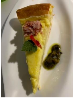
Nessel-Nidel Rahmkuchen, Saucisson, Brennessel